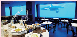
食事エリア：ビーチエリア (食事中にシャチが見えないエリアとなります)