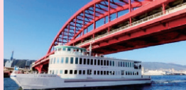
神戸ベイクルーズ ロイヤルプリンセスで 神戸港一周