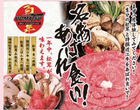
※4名で1鍋となります(お取り分け用の菜箸付き)

旅行日 | 6月3日(火) | 会員負担額 | お一人様 17,500円 (一般料金 22,500円)