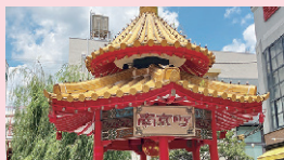
南京町 中国情緒あふれる町並みで グルメとショッピングをお楽しみ！

旅行日 | 4月17日(木) | 会員負担額 | お一人様 12,980円 (一般料金 17,980円)